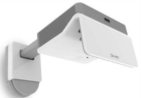
SMART LightRaise SLR60wi Videoproiector interactiv

Ghid audio. AVITECH a furnizat, de asemenea, sistemul de ghid audio pentru vizitatori și a asigurat înregistrarea conținutului în mai multe limbi. Sunt disponibile 30 de playere audio cu căști